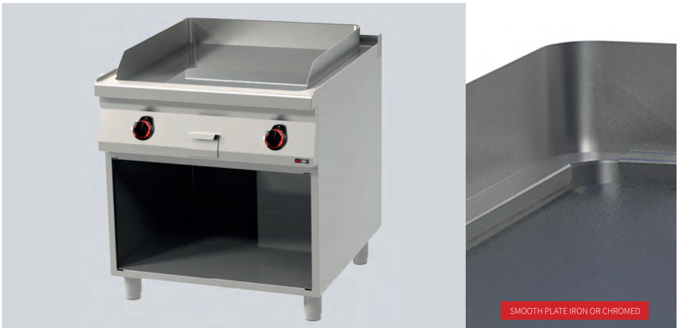
SMOOTH PLATE IRON OR CHROMED

Wide selection of electric griddle plates with 12 mm top griddle plate with excellent heat conduction. Equipped with a welded peripheral rim to comply with highest hygienic requirements. Standard GN sizes of 400 and 800 mm in width. Available on an open cabinet with or without stainless steel doors.